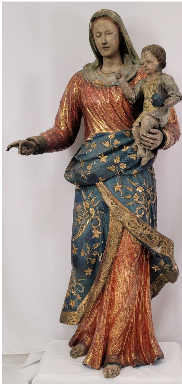
Zustand vor der Restaurierung