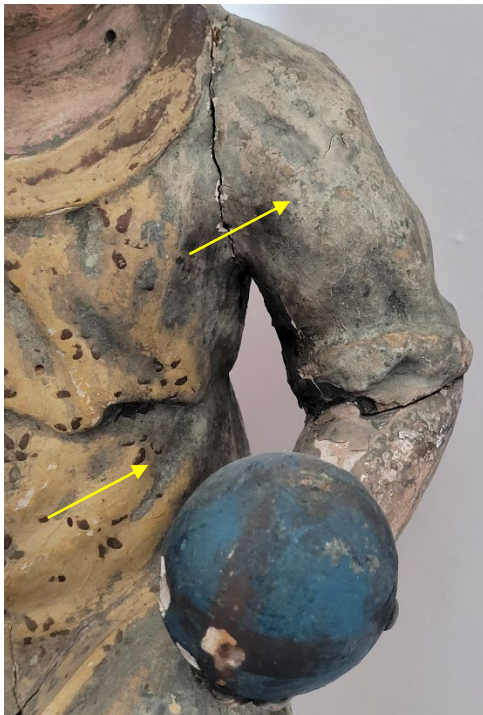
Unvollständig freigelegte Bereiche der Fassung zeigen zeitgleich unterschiedliche Fassungen (Arm und Faltentiefen wurden nicht freigelegt)

Die Fassung zeigt ein sehr uneinheitliches Erscheinungsbild. Während in großen Bereichen die Erstfassung freigelegt wurde, sind in anderen Bereichen noch großflächig jüngere Fassungsschichten erhalten. Diese passen nicht nur zeitlich nicht zusammen, sondern unterscheiden sich auch farblich sehr stark voneinander. Auch wurden große Bereiche neu mit Farbe oder Goldbronze übermalt. Diese zeichnen sich deutlich von der Originalfassung ab, da sie oftmals zu dunkel sind oder wie die Bronzeübermalungen dunkel oxidiert sind.