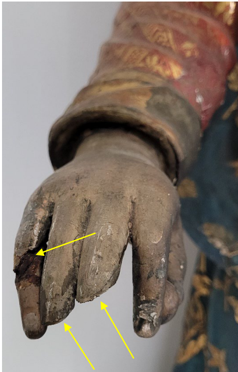
Fehlende Fingerglieder und alte, fehlerhafte Verleimung