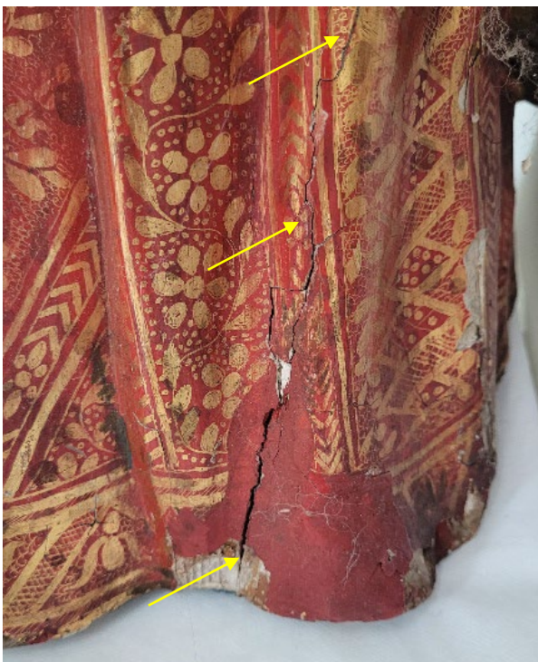
Langer und tiefer Riss im Holz