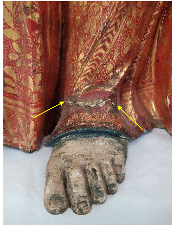
Bruchstelle am Fuß