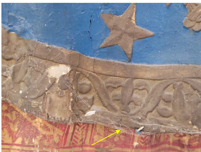
Durch Spinnenweben und Staub verschmutzte Oberfläche. In anderen Bereichen liegt eine sehr dunkle feste Schmutzschicht auf der Malschicht, wie beispielsweise auf den Inkarnaten.