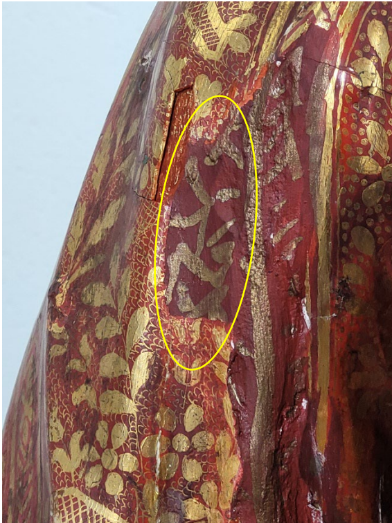
Originale Bereiche der Malschicht wurden überkittet und grob übermalt.