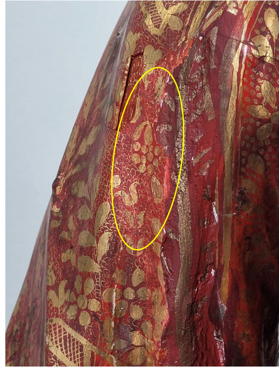
Nach Abnahme der Überkittungen konnten originale Malschichten freigelegt werden, so dass die filigrane goldene Detailzeichnung wieder sichtbar wird.