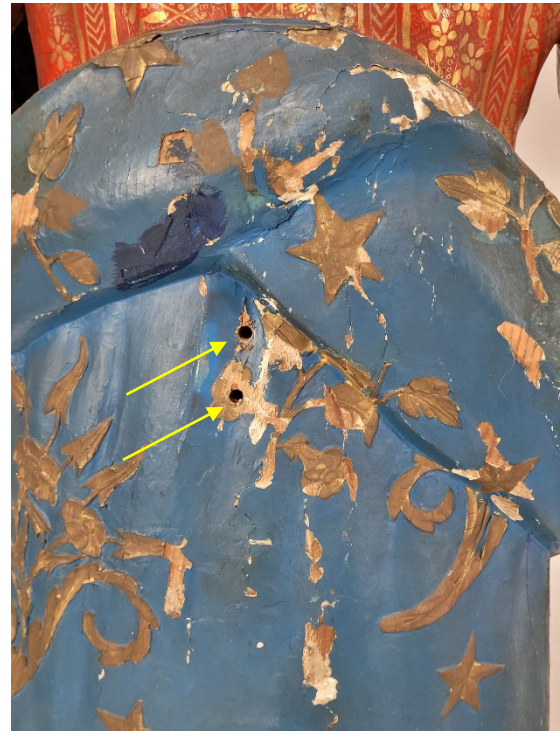
Zwei Bohrlöcher einer älteren Wandbefestigung