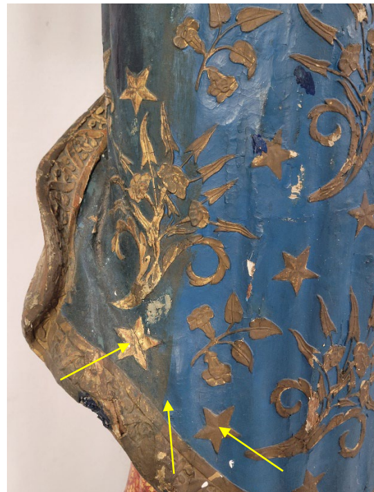
Großflächig übermalte Bereiche mit nachgedunkelter Farbe und oxidiertes Bronze