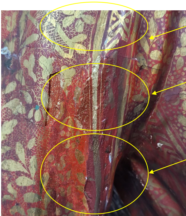
Sichtbar ist die originale Malschicht mit roter Farbe und filigraner Detailzeichnung in Gold.